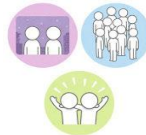
3密（密閉、密集、密接）を避けよう