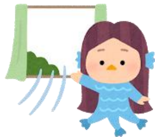
30分に1回以上換気しよう