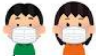
マスクを着けよう